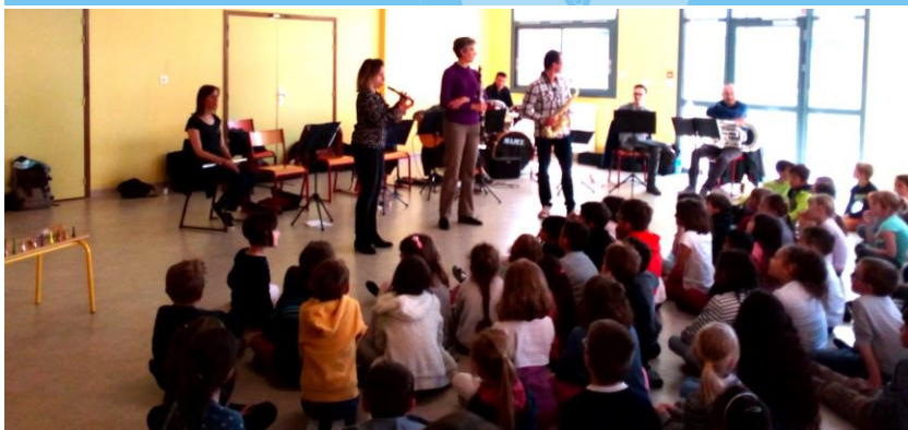
Concert à Franclens