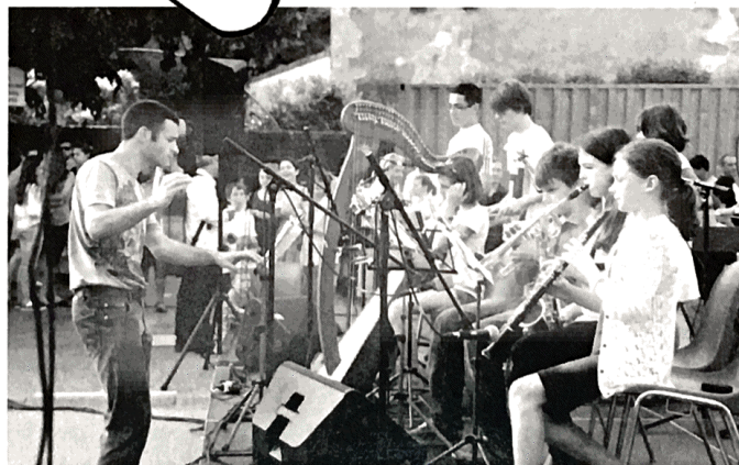
Fête de la musique à Frangy